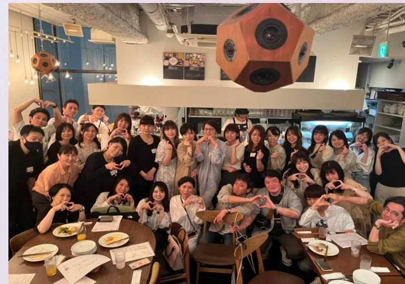
(第1回交流会：掲載許可済)